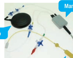
Manometro 3 canali

Col KIT EMA siete guidati a schermo, lavorate con le mani libere ed effettuerete misurazioni e registrazioni col pedale. Alla fine della valutazione, viene automaticamente preparata una seduta di rieducazione che tiene conto dei valori stabiliti.